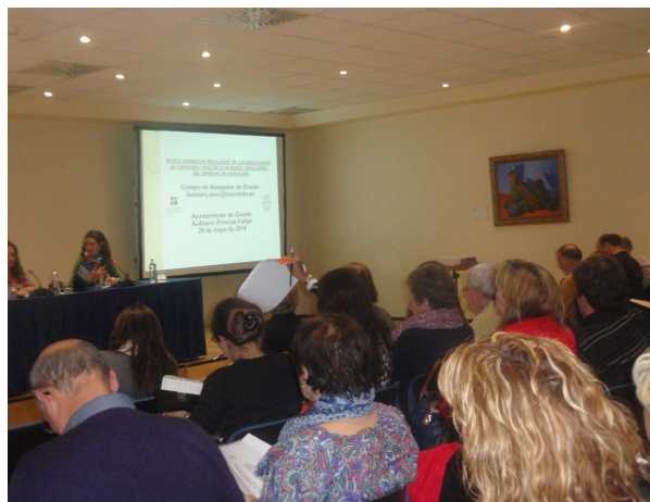
Momento de las Jornadas, en el Auditorio Príncipe Felipe

Estas Jornadas inauguran un proceso de participación ciudadana pionero en Oviedo, cuyo objetivo es diseñar colectivamente un proyecto para transformar la antigua autopista en un espacio urbano abierto, integrador y que satisfaga las necesidades de la gente que vive en su entorno y en toda la ciudad. En la siguiente fase, a través de talleres colaborativos y abiertos a toda la ciudadanía, se elaborará un anteproyecto con las líneas maestras de la actuación; posteriormente se convocará un concurso de proyectos y mediante votación popular se elegirá la propuesta ganadora.