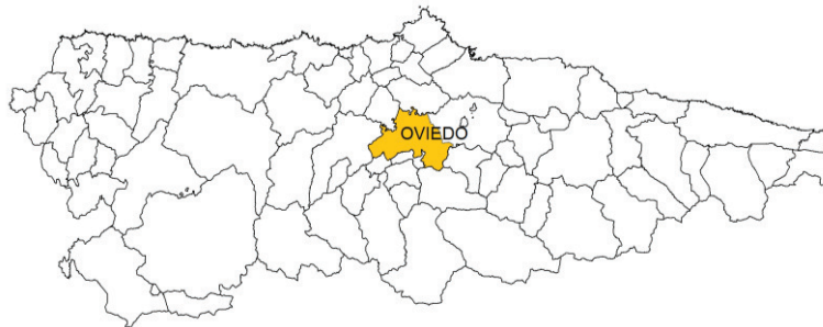
Contexto regional: capital de la Comunidad Autónoma, posición central:

- Localización y contexto administrativo. El municipio de Oviedo se encuentra prácticamente en el centro de la región. Limita con los siguientes concejos: al norte con Llanera, al este con Siero y Langreo, al oeste con Grado y las Regueras y al sur con Ribera de Arriba, Santo Adriano y Mieres. La superficie municipal es de 186,65 km 2 (SADEI, 2016). En la sierra de Fayeu se alcanza la cota más alta, 714 m, en el Pico Escobín o Picayo.